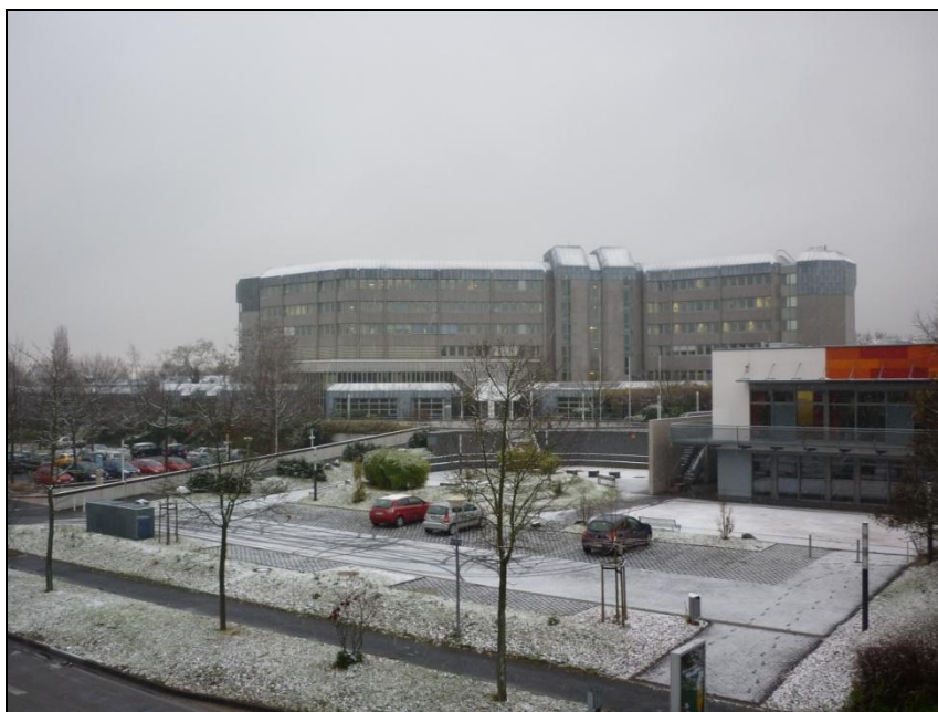
Obr. 1 Budova Spolkového archivu v Koblenzi