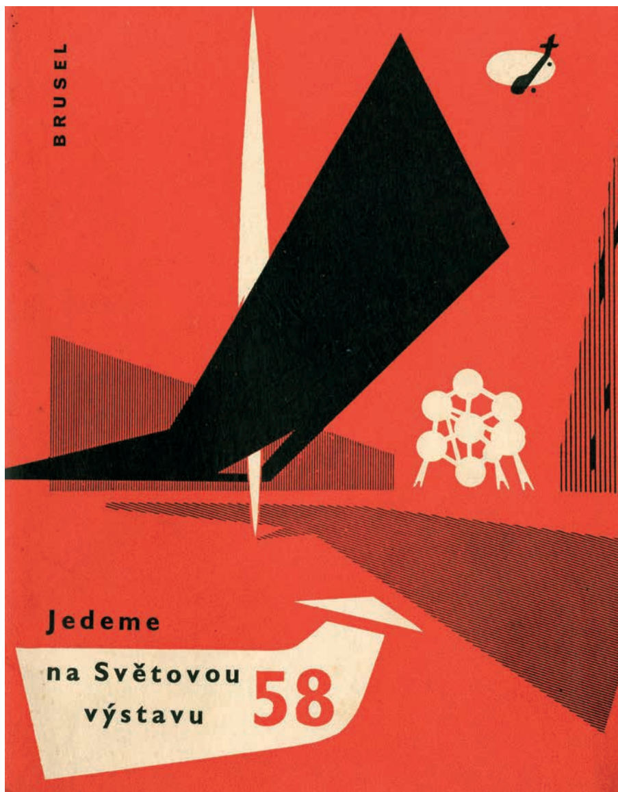
Obr. 1 Technický scénář československého pavilonu (Národní archiv, fond Československá obchodní a průmyslová komora, Praha)