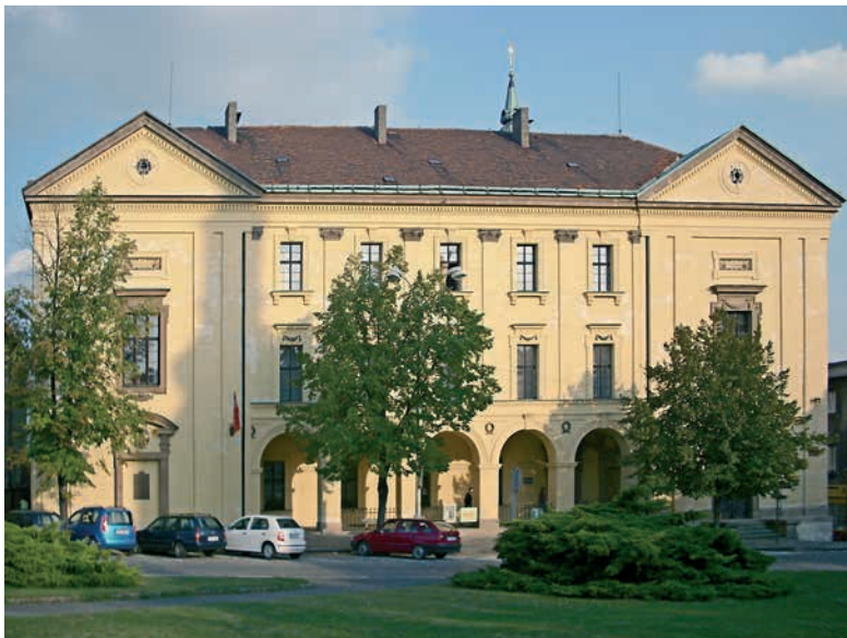
Budova bývalé piaristické koleje ve Slaném – dnes vlastivědné muzeum, kde se odehrávaly oslavy 12.9. 2008 i seminář 7.10. 2008.