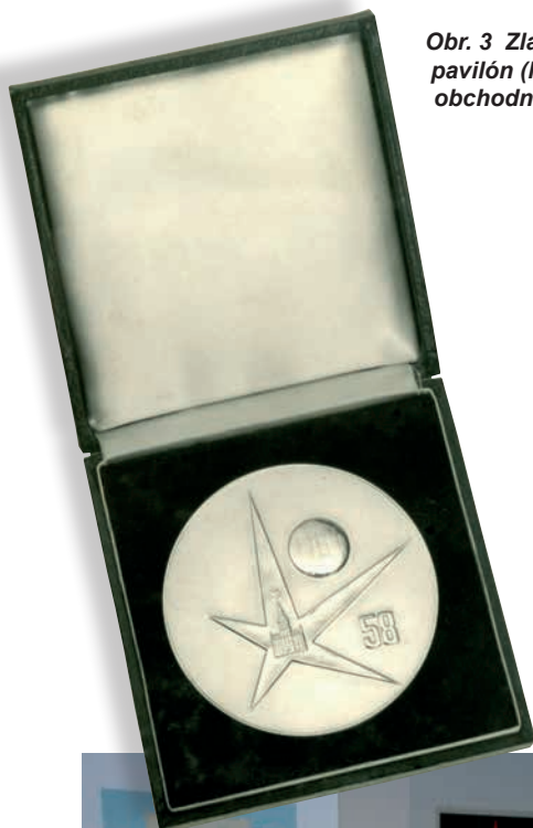
Obr. 3 Zlatá hvězda pro československý pavilón