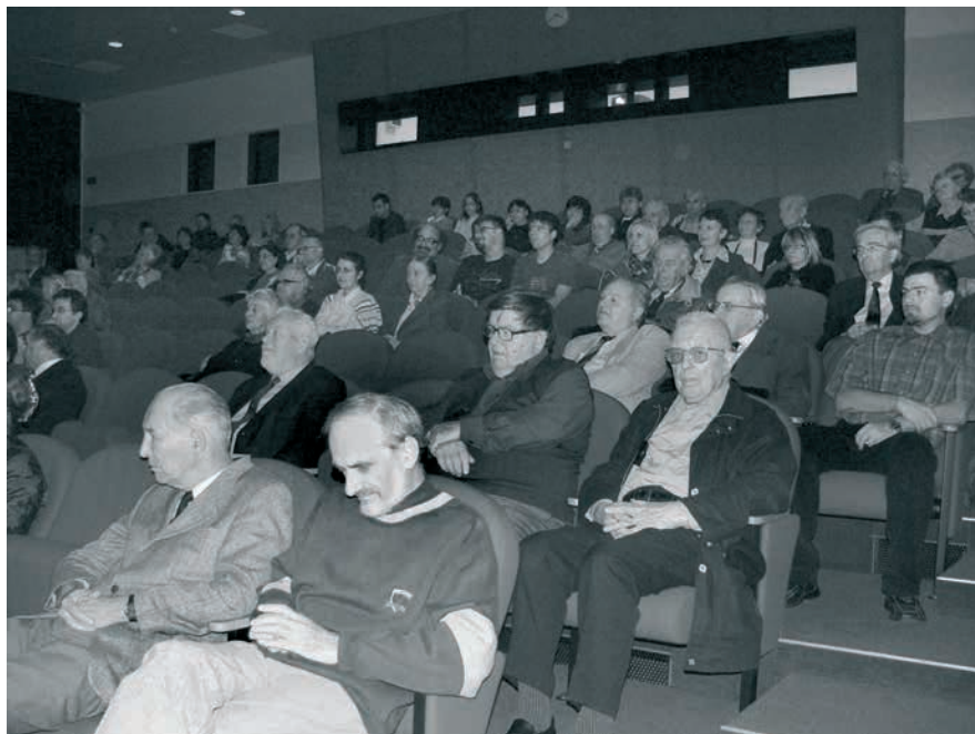
Účastníci 3. setkání přátel Národního archivu, foto Marie Zdeňková.

Všechny dokumenty digitalizované v rámci projektu VISK 7 – Kramerius jsou pak přístupné podle autorských a majetkových práv buď přímo na Internetu prostřednictvím portálu Kramerius 10 (volné dokumenty) nebo prostřednictvím portálu Kramerius ve studovnách Národní knihovny.