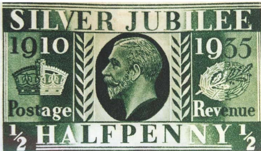
Britská jubilejní známka (originál 25 × 40 mm)