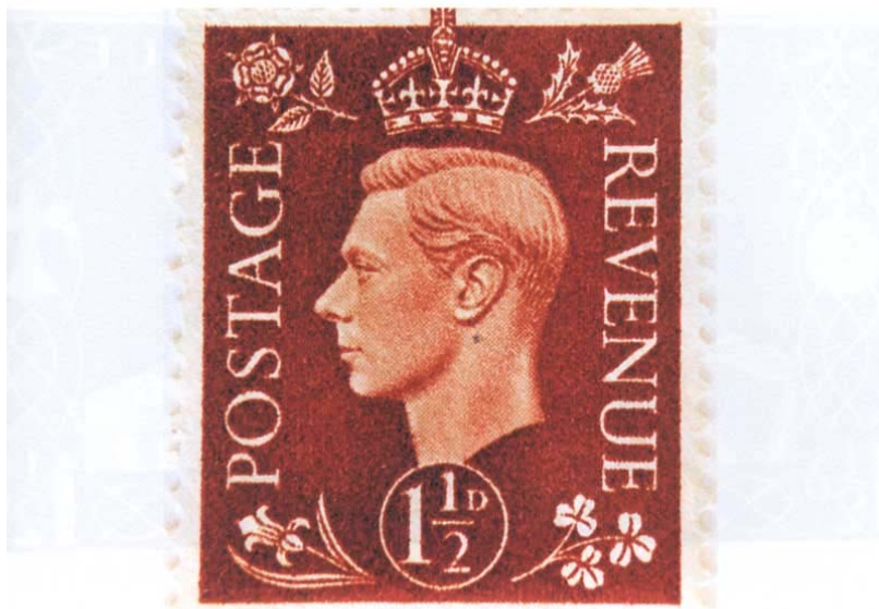
Známka za jeden a půl penny, portrét krále Jiřího VI., 1937, originál 34 × 29 mm