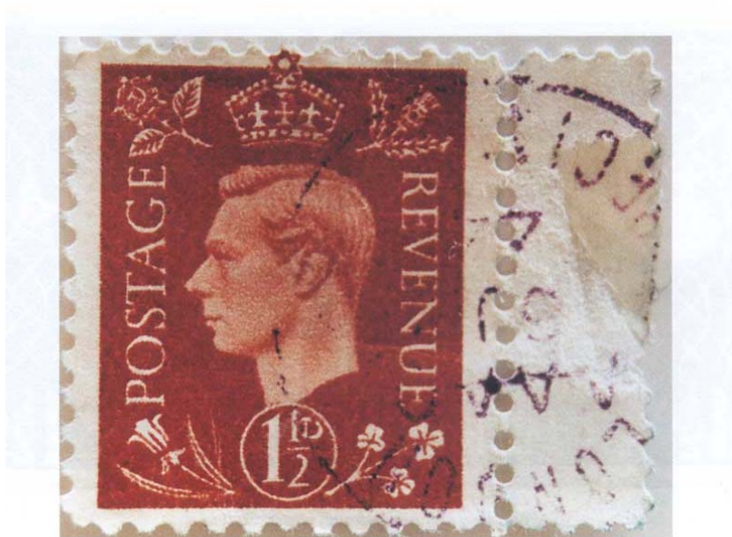
Padělek známky za penny a půl

Jedenapůlpencová známka s portrétem krále Jiřího VI. Originál má na vrcholku koruny královský kříž, padělek je opatřen židovskou hvězdou.