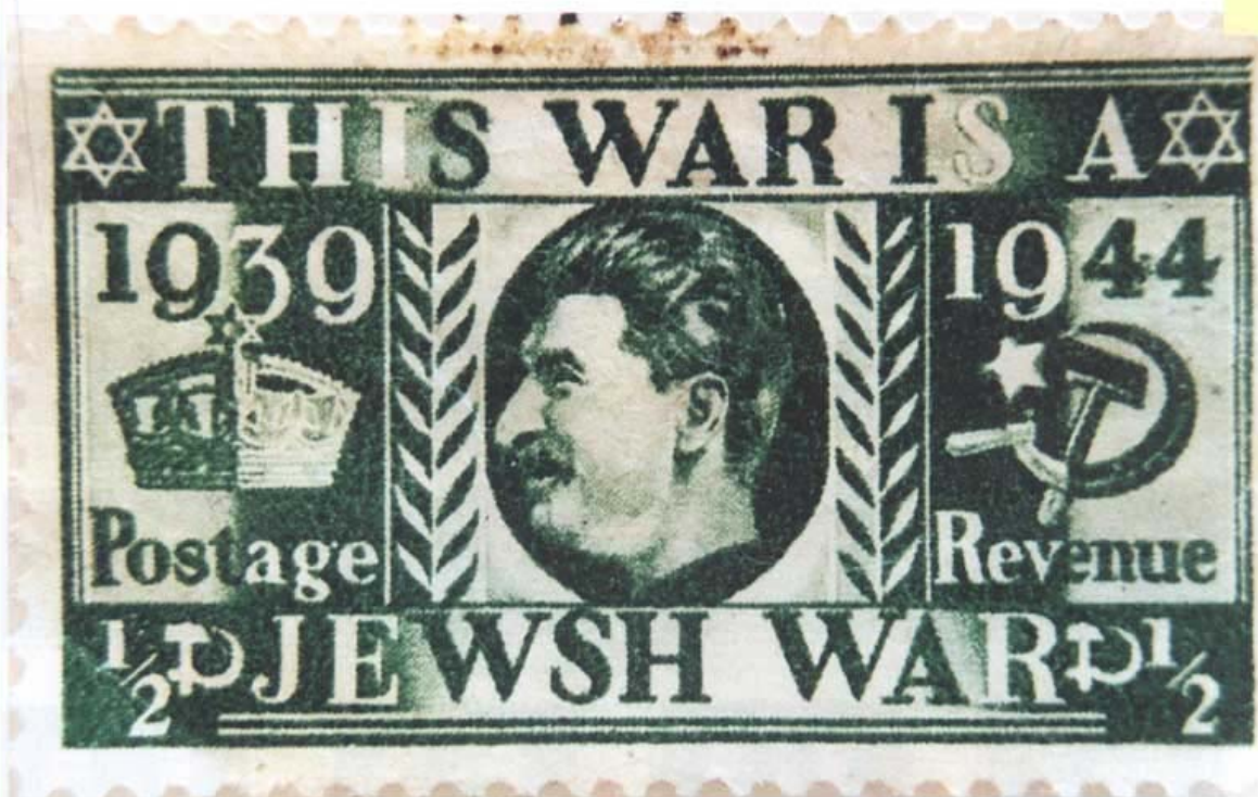
Padělaná britská jubilejní známka

Britská jubilejní známka v hodnotě půl penny má na padělku místo Jiřího V. obraz Stalina a nápis "Tato válka je židovská", vpravo se srpem a kladivem.