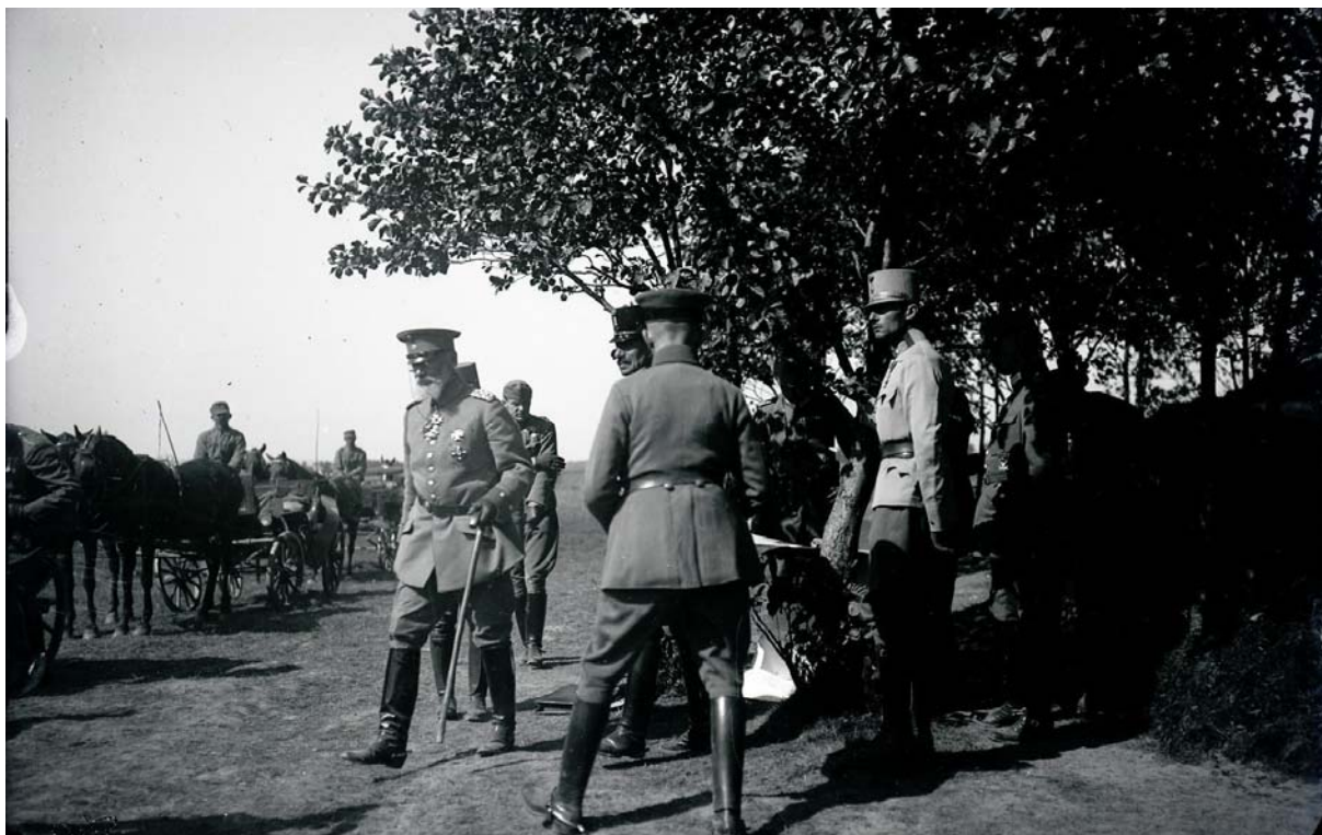
Princ Leopold Bavorský mezi vojáky při vojenské prohlídce u dělostřelců. Poškození negativu mírné. Inv. č. 1323.