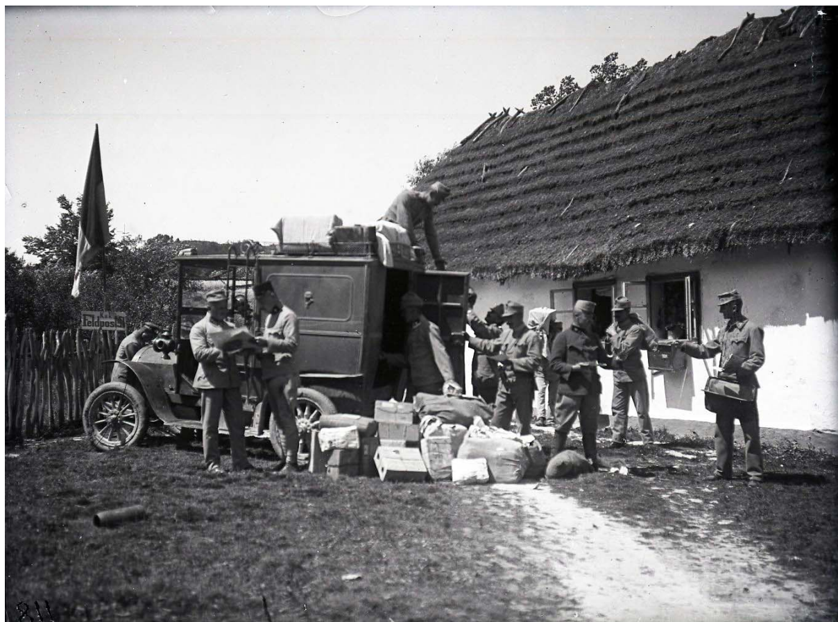
Uszkowice - vojáci u chalupy při rozdělování polní pošty. Poškození negativu mírné. Inv. č. 921.

Pokud nám může badatelská veřejnost poskytnout jakékoliv zpřesňující či doplňující informace budeme velmi rádi. Psát můžete na e-mail: naffkd@nacr.cz .