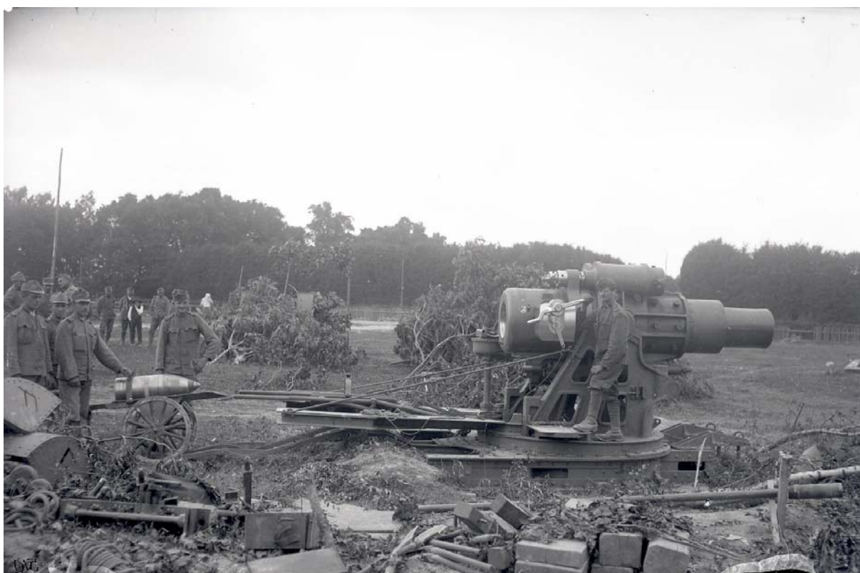
Vojenské cvičení - vojáci při nabíjení 30,5cm hmoždíře. Poškození negativu mírné. Inv. č. 1293.