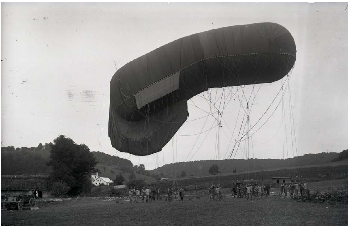
Vojenské cvičení - vojenský létající balón připevněný nad zemí. Poškození negativu mírné. Inv. č. 1289.