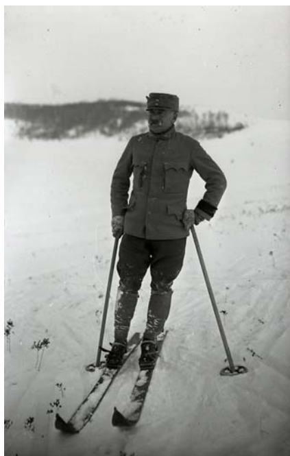
Podhorce, lyžování - generál Goglia na lyžích. Poškození negativu mírné. Inv. č. 1279.