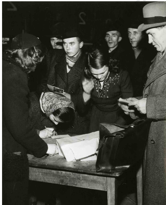
Hromadné odjezdy mladých lidí ročníku 1924 na práci do Říše