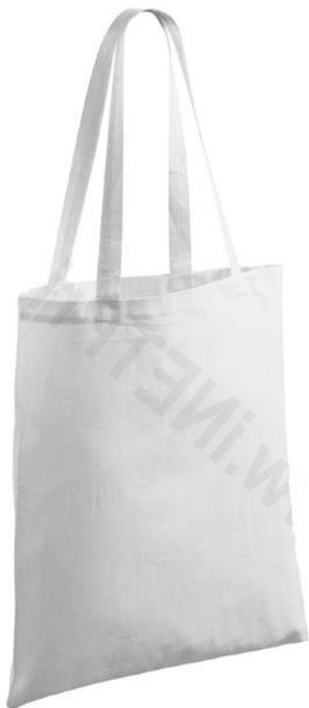
Ilustrační návrh potisku, var. 1

VALUE ADDED, a.s. zajistí grafický návrh, podklady pro tisk, produkci a dodání tašek do sídla Národního archivu.