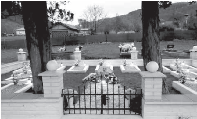
Obr. 1: Obnovené hroby československých vojakov padlých pri Tisovci v júni 1919. Obnovu vojnových hrobov zrealizovalo OZ Gemerské grúne s podporou Banskobystrického kraja, Ministerstva obrany Českej republiky a Nadácie Milana Rastislava Štefánika. V Tisovci na mestskom cintoríne je v jednotlivých hrobch pochovaných 13 vojakov, z toho 7 padlých v Prvej svetovej vojne a 6 československých vojakov, padlých v bojoch o Tisovec počas bolševického vpádu. Súčasťou pamätného miesta je aj masový hrob, na ktorom je umiestnená pamätná tabuľa pripomínajúca všetkých známych padlých československých vojakov v okolí Tisovca.