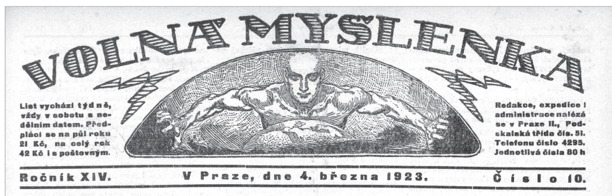
Záhlaví titulní strany časopisu Volná myšlenka , 1923.