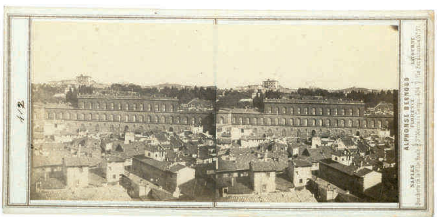
Palác Pitti, stereoskopická fotografie, 1856 (NA, RAT, Fotografie, stereoskopie, Florencie)