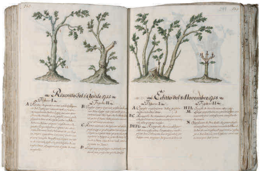
Návod na pěstování jedlých kaštanů (NA, RAT, Petr Leopold, inv. č. 2)