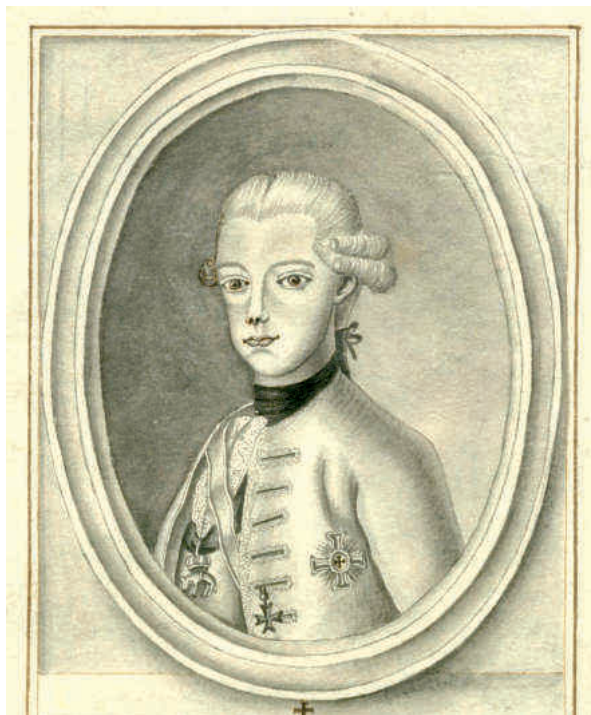
Petr Leopold, výřez z mapy, 1780 (NA, RAT, Mapy a plány, inv. č. 150)