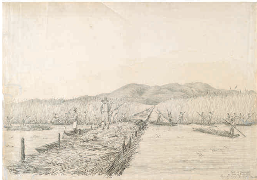
Rekultivace přímořské Maremmy, 1832, kresba Giorgio Angiolini (NA, RAT, Grafika, kresby a tisky, soubor kreseb Maremma)