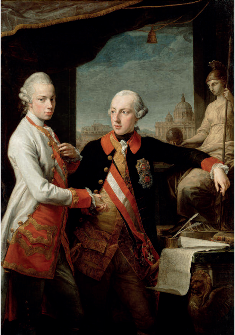
Portrét císaře Josefa II. a jeho mladšího bratra, toskánského velkovévody Petra Leopolda, od Pompea Batoniho, 1769, olej na plátně, Kunsthistorisches Museum Wien.