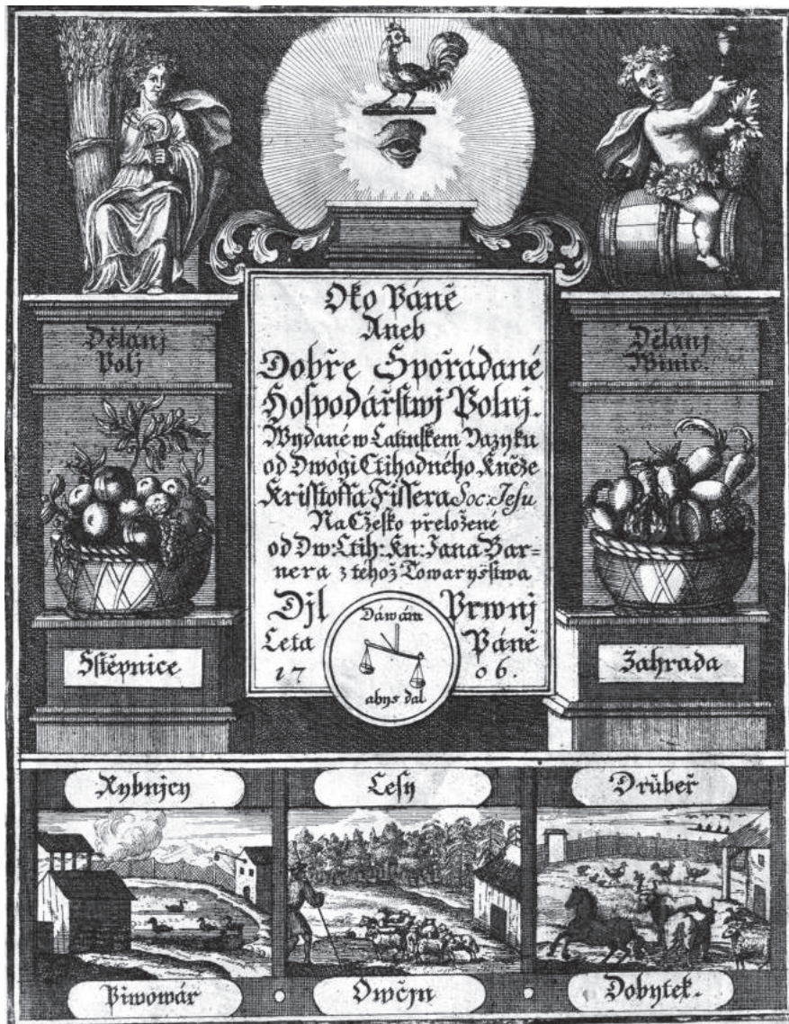
Titulní strana s frontispisem Fischerových Knih hospodářských, které vyšly v Praze roku 1706 (Knihovna Etnologického ústavu AV ČR, v. v. i., sign. ST 97/I)