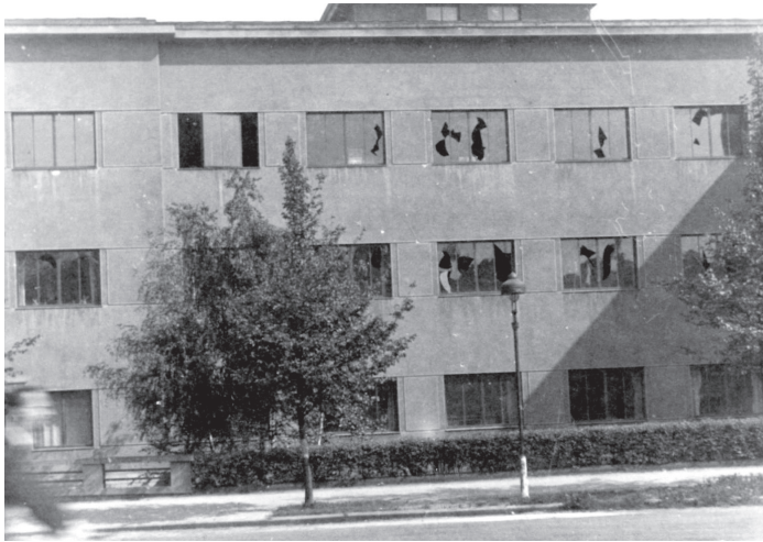
obr. 1 Průčelí Archivu země České rozbité při Pražském povstá- ní 1945