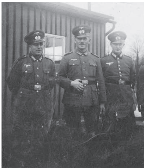
Skupinová fotografie z vojenského výcviku