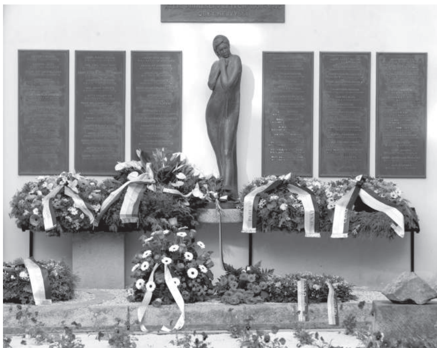
Pomník obětem druhé světové války z ústředí Československé obce sokolské umístěný v atriu Tyršova domu (foto Kateřina Pohlová)