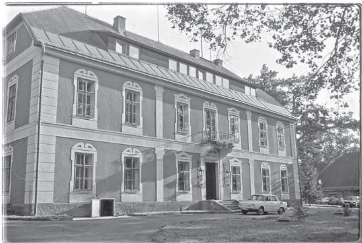
Obr. 5. Návarov (okr. Jablonec nad Nisou), vstupní průčelí zámku od severovýchodu, stav 18. září 1993