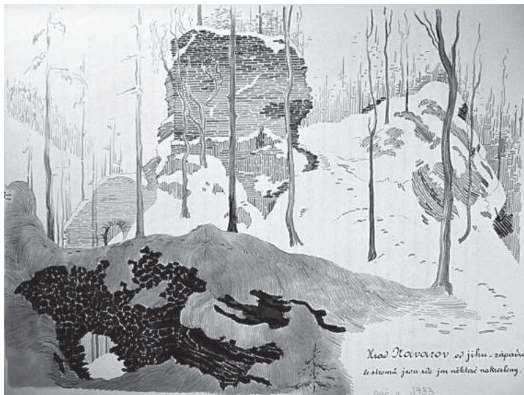
Obr. 4. Návarov (okr. Jablonec nad Nisou), zřícenina hradu od jihozápadu. Kresba Viléma Vanička pravděpodobně z roku 1933 (SOKA Jablonec nad Nisou, Návarov, Popis a dějiny statku pod Krkonošemi, rukopis, první díl, s. 33)