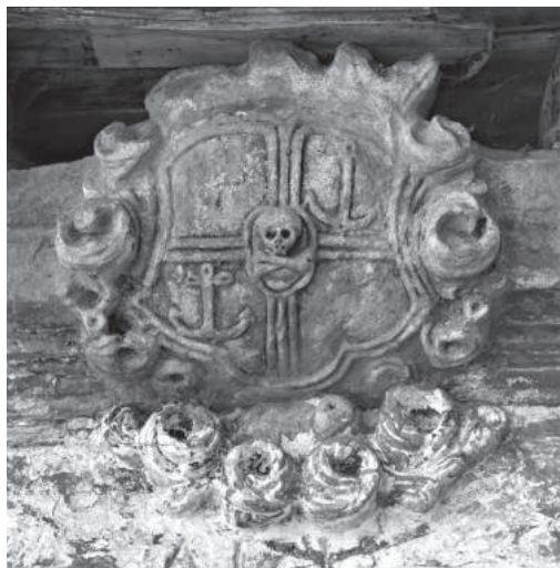
Obr. 1. Rodový erb Lamottů z Frintropu, umístěný nad vstupem do zámecké kaple svatého Jana Křtitele v Jesenném. Stav 11. července 2021