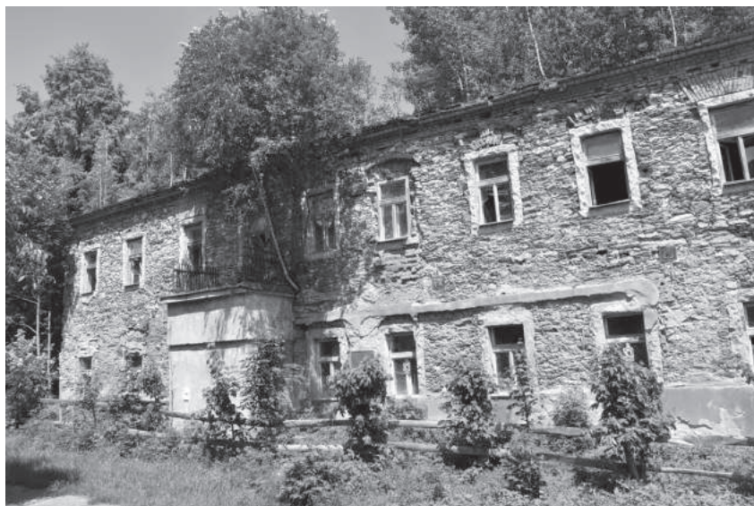
Obr. 7. Jesenný (okr. Semily), kdysi půvabná zámecká stavba se vlivem neprovádění údržby změnila ve zříceninu. Stav 11. července 2021