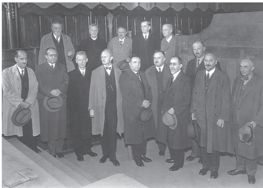
Akademický senát Univerzity Karlovy (roce 1935) AHMP, Vojtíšek, inv. č. 2312–2313, sign. V.C-D, kart. 194.