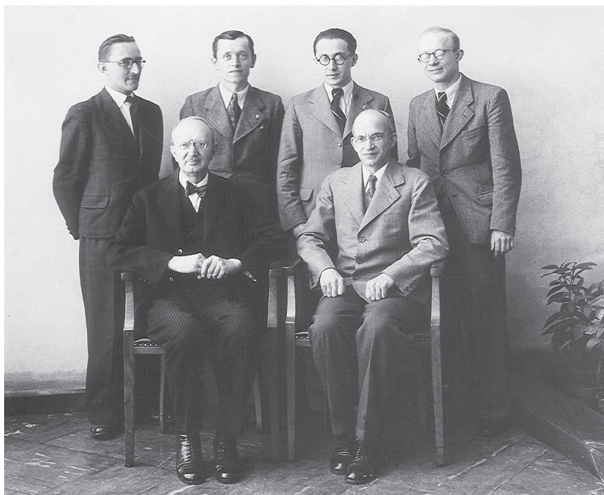
Pedagogický sbor Archivní školy (1940) AHMP, Vojtíšek, inv. č. 2312–2313, sign. V.C-D, kart. 194.