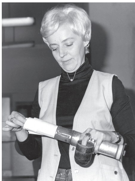
Manipulantka pošty Praha 023 ve Vysočanech