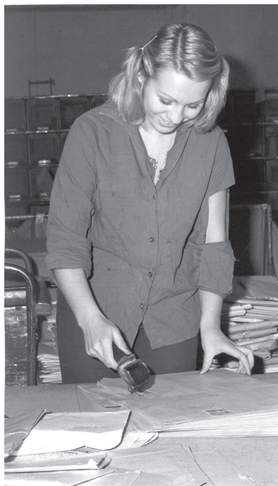
Orážení zásilek na poště Praha 025 na Gorkého (dnes Senovážném) nám. v Praze 1, foto Tomáš Vosolsobě, září 1977. (Sbírka PM, inv. č. FRS468, přír. č. 26/2008)