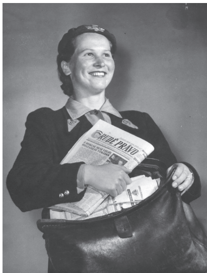
Doručovatelka tisku, 1959–1963. (inv. č. FRS1588, přír. č. 166/2012)