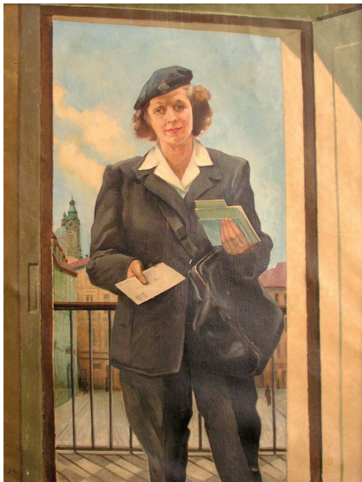
Jaroslav Poš: Listovní doručovatelka ve stejnokroji vz. 1950, olej na plátně, asi 1951. (Sbírka PM, inv. č. O140, př. č. 92/2002)