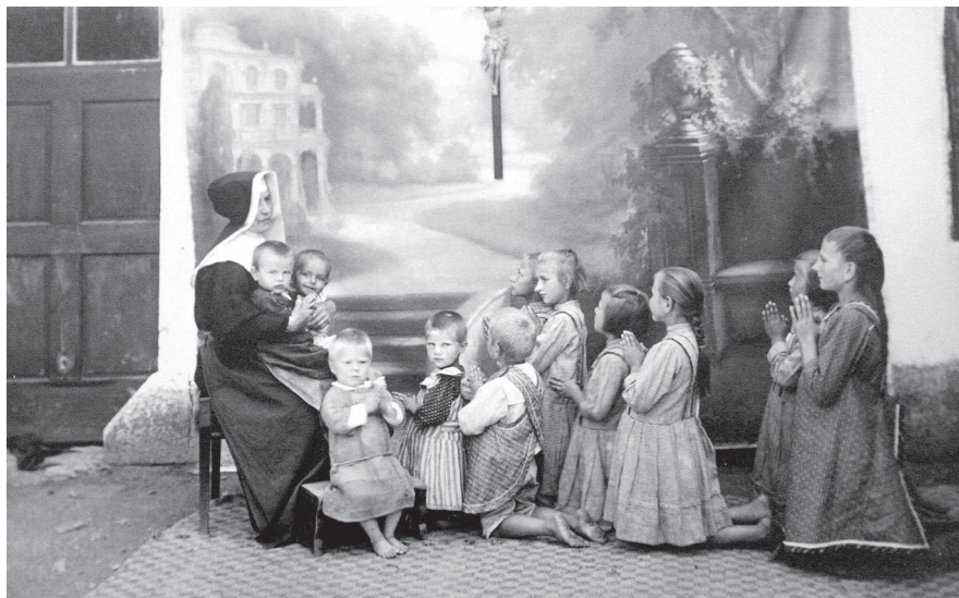
Ústav korunního prince Rudolfa v Nové Říši – všední den v životě ústavu – nedatováno