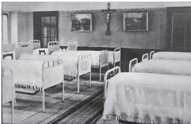
Interiér klášteřa na Údolní ulici v Brně – nedatováno