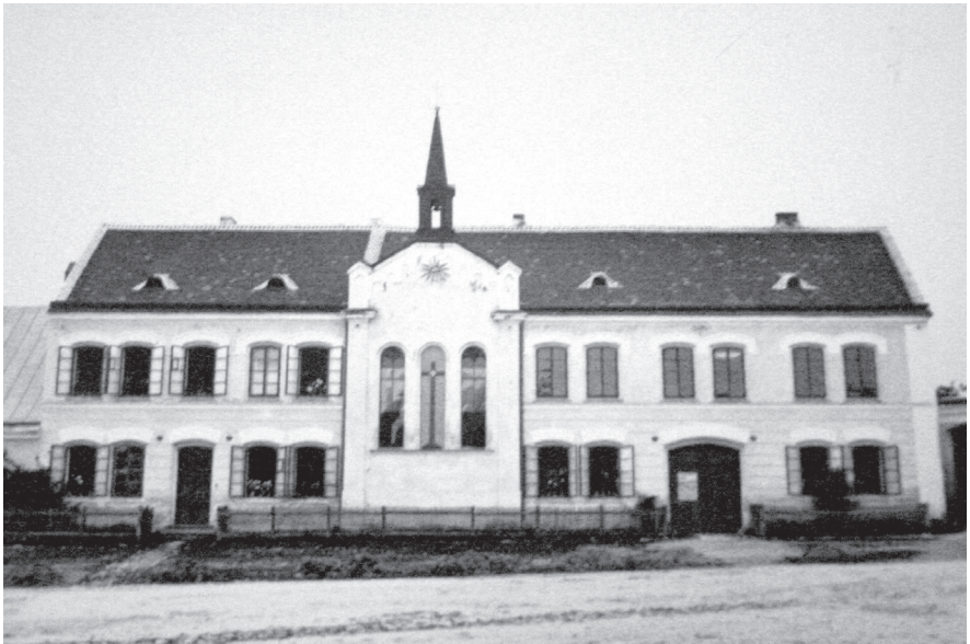
Starší a novější podoba Ústavu korunního prince Rudolfa v Nové Říši – nedatováno