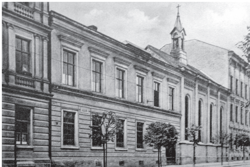
Klášteř boromejek na Údolní ulici v Brně – nedatováno