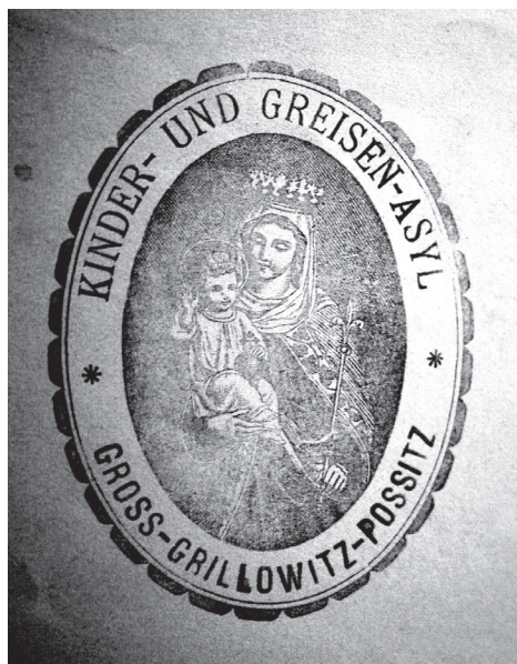
čRazítko azylu pro děti a starce ve Velkých Křídlovicích-Božicích (Moravský zemský archiv, fond B 22 Zemská školní rada, č. j. 17 265, kart. 304)