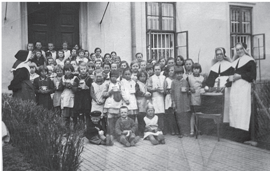
Stravování lišeňských dětí polévkou vařenou v klášterní kuchyni ve školním roce 1930/31