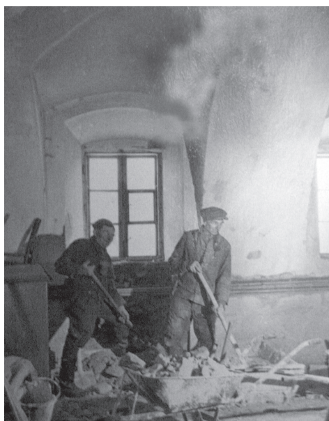
Stavební úpravy ve Znojmě-Hradišti v roce 1958