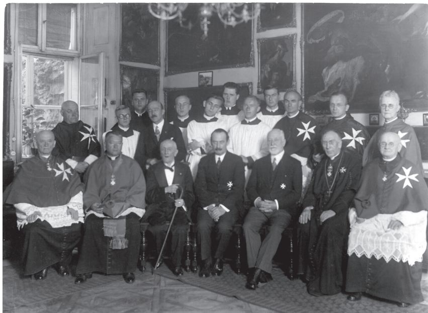
Obr. 2 Společná fotografie některých členů konventu s velmistrem, velkopřevorem a jejich doprovodem, 1931