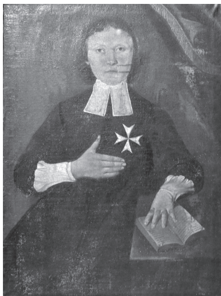
Obr. 4 Neidentifikovaný kaplan z poslušnosti působící ve Strakonických v řádovém každodenním oděvu, 2. polovina 18. století (České velkopřevorství)