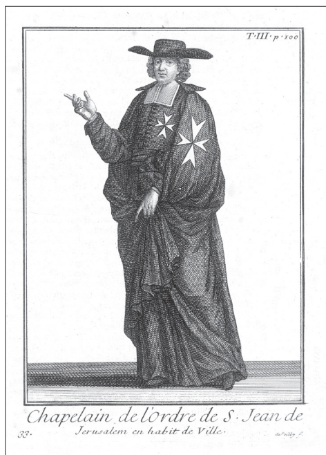
Obr. 5 Kaplan z poslušnosti v řádovém vycházkovém oděvu, 1715 (KNA, Knih.Malt., sign. Malt 2301/2, Hélyot, Pierre. Histoire des ordres monas- tiques, ... Tome troisième. A Paris 1715)