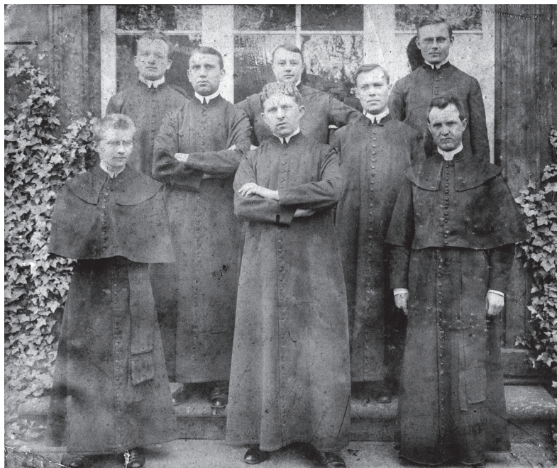
Obr. 3 Společná fotografie všech kleriků a noviců konventu, 1913 (NA, ŘM, inv. č. 644, kart. 328)