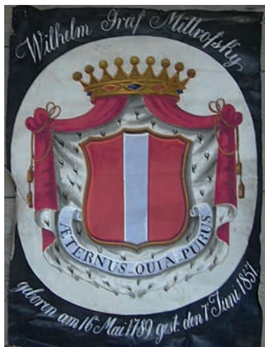
19. Vilém Mitrovský z Nemyšle, †7.6.1857