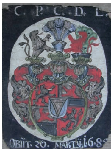
4. Kryštof Filip z Lichtenštejna-Kastelkornu, †26.3.1685