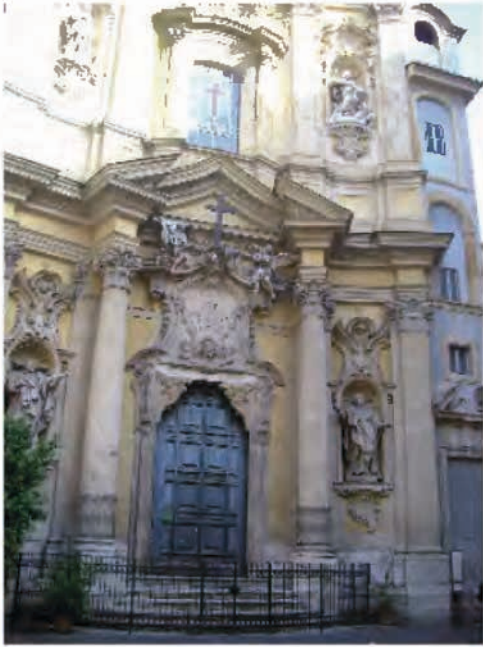
Kamiliánský kostel sv. Maří Magdaleny na stejnojmenném náměstí v Římě

Františkánský konvent sv. Bonaventury na Palatinu v Římě