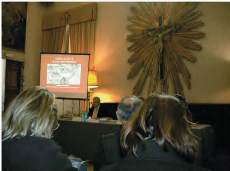
Jednání semináře Svatí církevních řádů z Říma nové doby - místa obrazy v Baldinioho sále při kostele sv. Marie ve Sloupoví v Římě