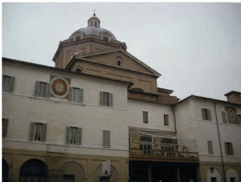
Chrám Il Gesu z nádvoří jezuitské koleje