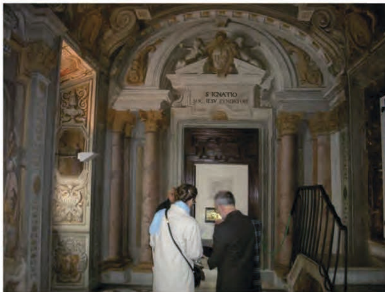
Světnice sv. Ignáce z Loyoly