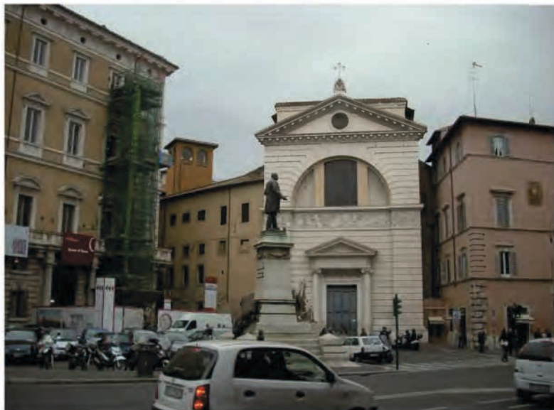
Chrám sv. Pantaleona s generálním domem piaristického řádu v Římě