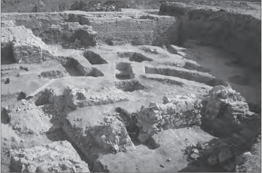
Záběr na archeologický výzkum předchůdců kostela sv. Václava. 1993. (V pozadí základy barokního kostela sv. Václava.)