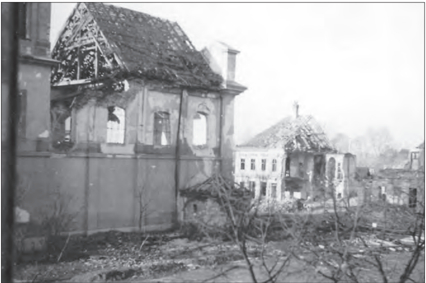
Trosky kostela od východu.