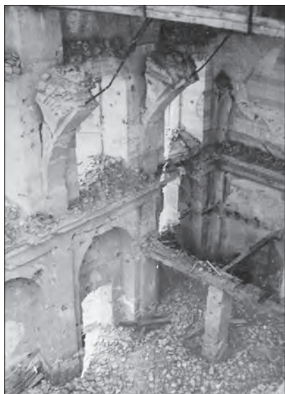
Pohled do lodi kostela. NPÚ Brno, inv. č. 38165.