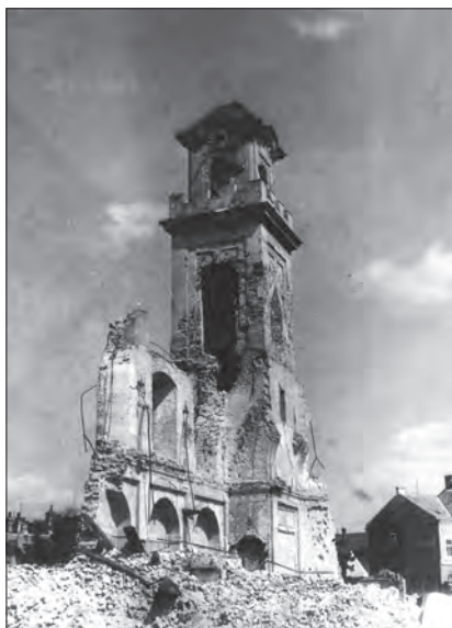
Odklizení trosek před zbouráním věže. 1946.