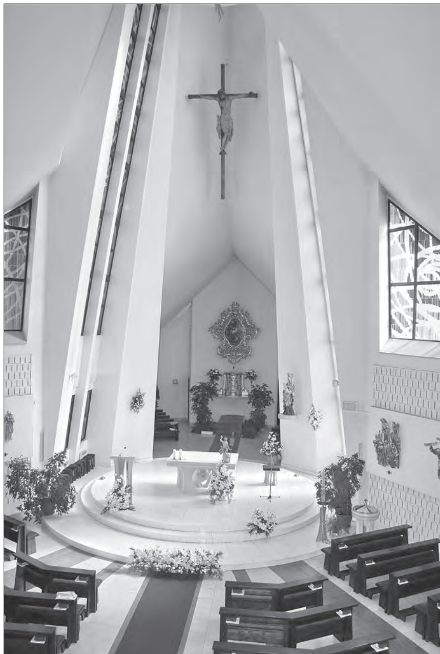
Interiér kostela sv. Václava. 2013.