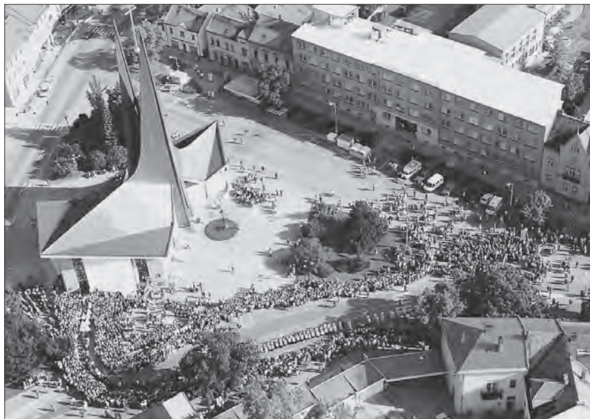
Letecký pohled na shromáždění věřících při vysvěcení kostela. 1995.