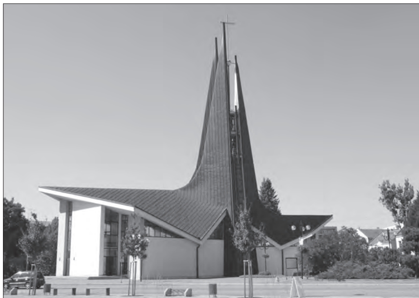
Exteriér kostela sv. Václava. 2013.