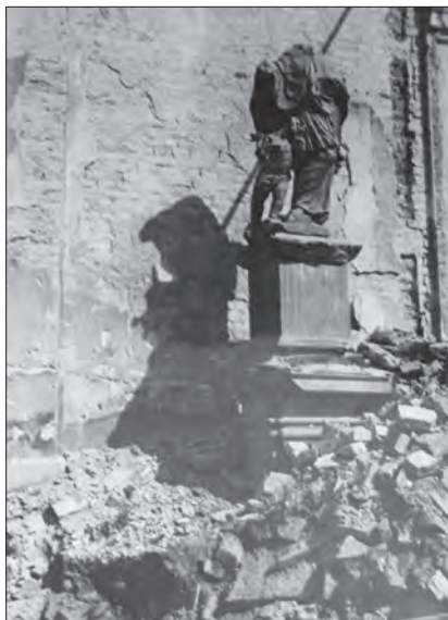
Poničená plastika sv. Floriána. NPÚ Brno, inv. č. 38153.