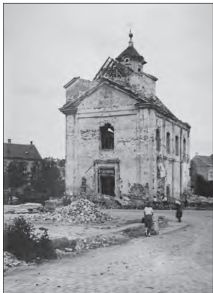
Pohled na severovýchodní průčelí kostela se vstupem. 1946. NPÚ Brno, inv. č. 38162.