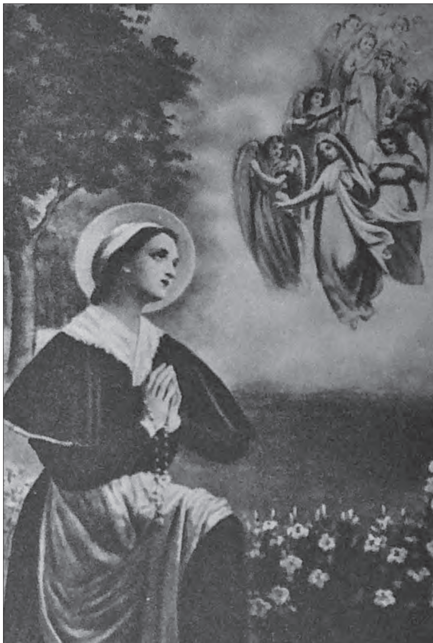
Svatá Voršila, drobná devoční grafika, poč. 20. století, SOA Praha, fond Voršilky Kutná Hora, kart. 51.