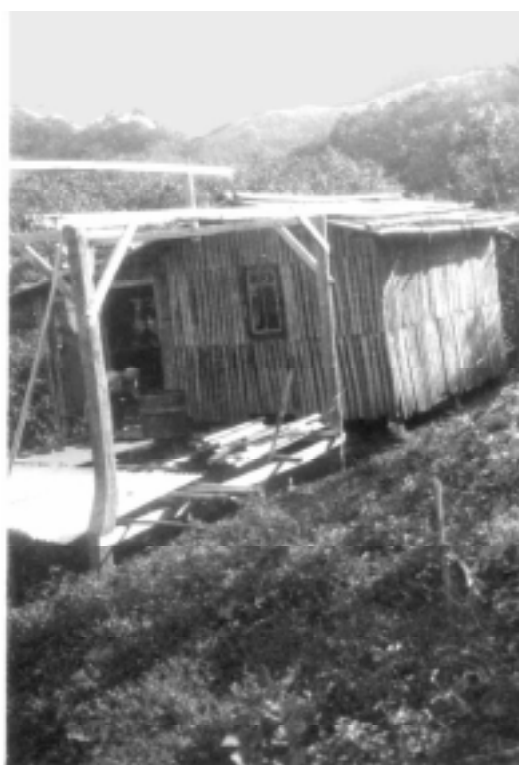
První domky postavené z buraa s bambusovou střechou