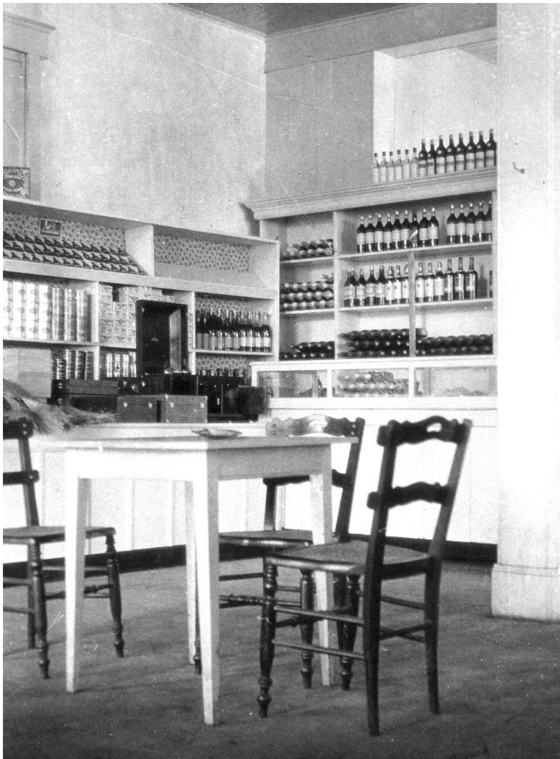
Obchod česko-francouzské společnosti v Papeete na Tahiti