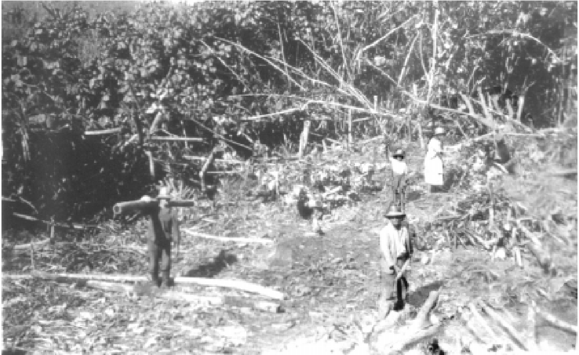
Kultivace pozemků porostlých buraem