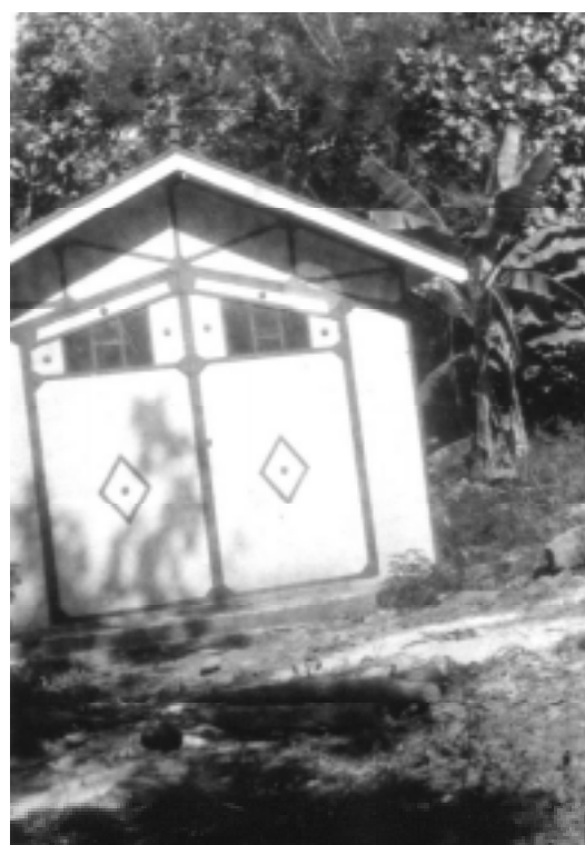
Nejlepší domek v Taiohae – ocelová konstrukce, stěny everitové