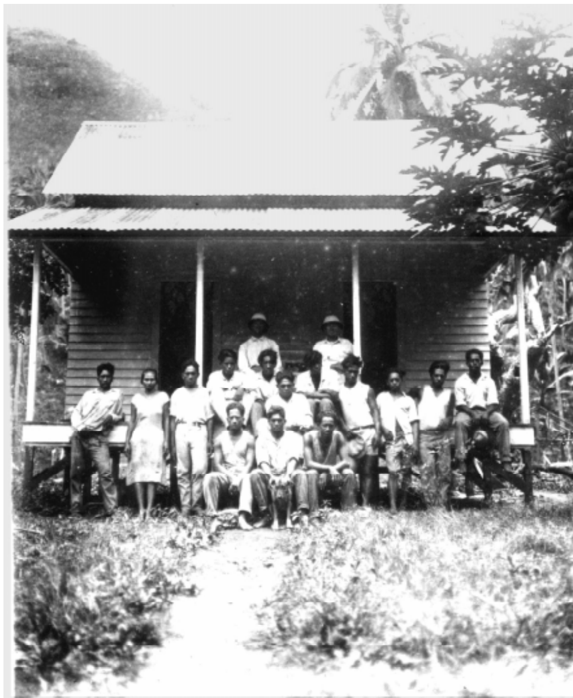
Mužstvo pracovní sekce kokosové plantáže, pracující pod československým dozorem a vedením

Fotografie zaslané českými krajany z ostrova Nuka Hiva (SÚA, MSP, sign. H 1/h-2-2, kart. 3949)