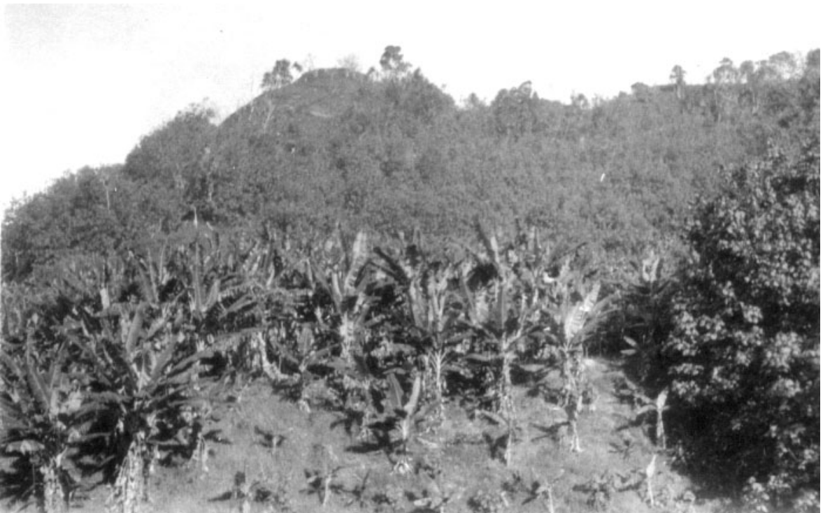
Banánové pole – československé plantáže na ostrově