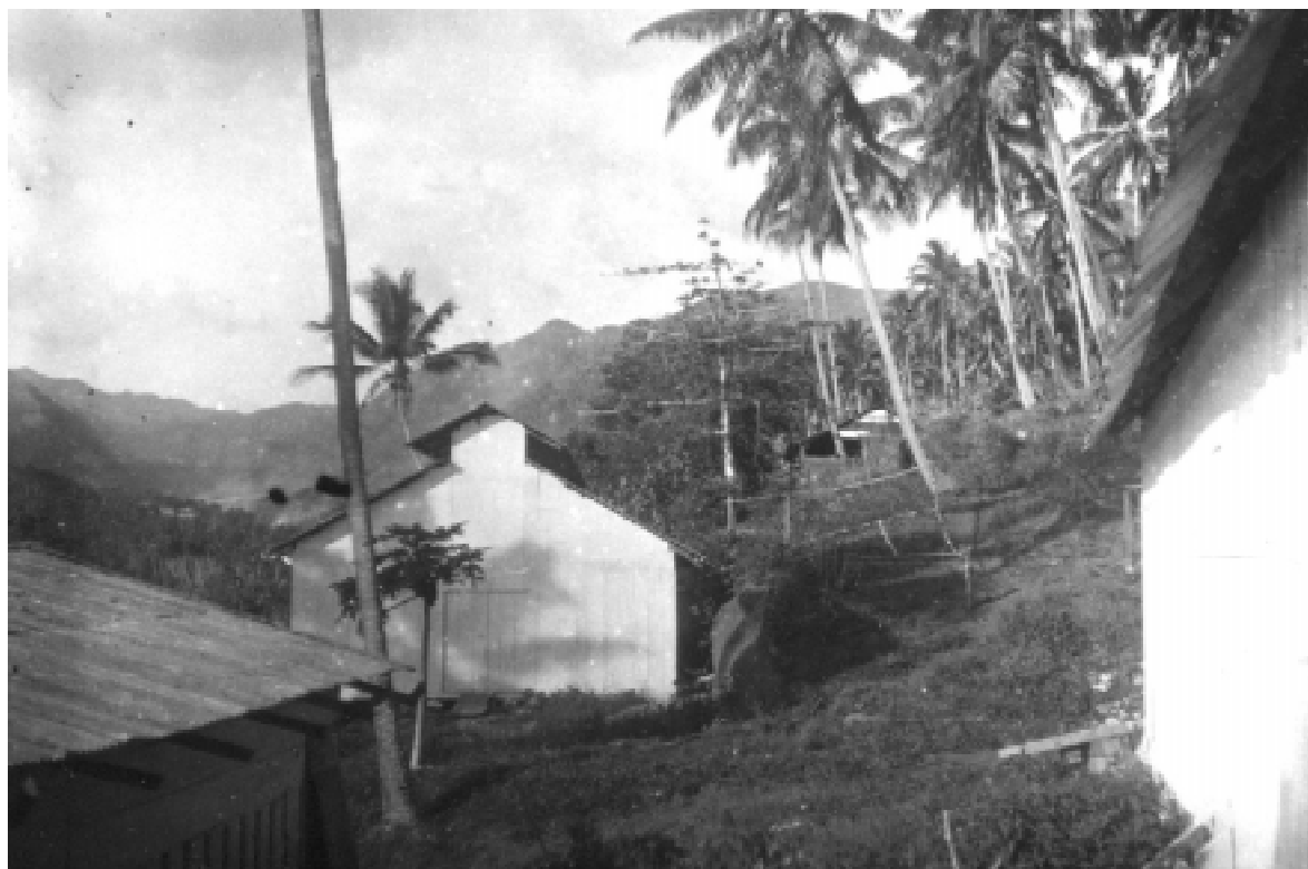
Skladiště zboží a kopry