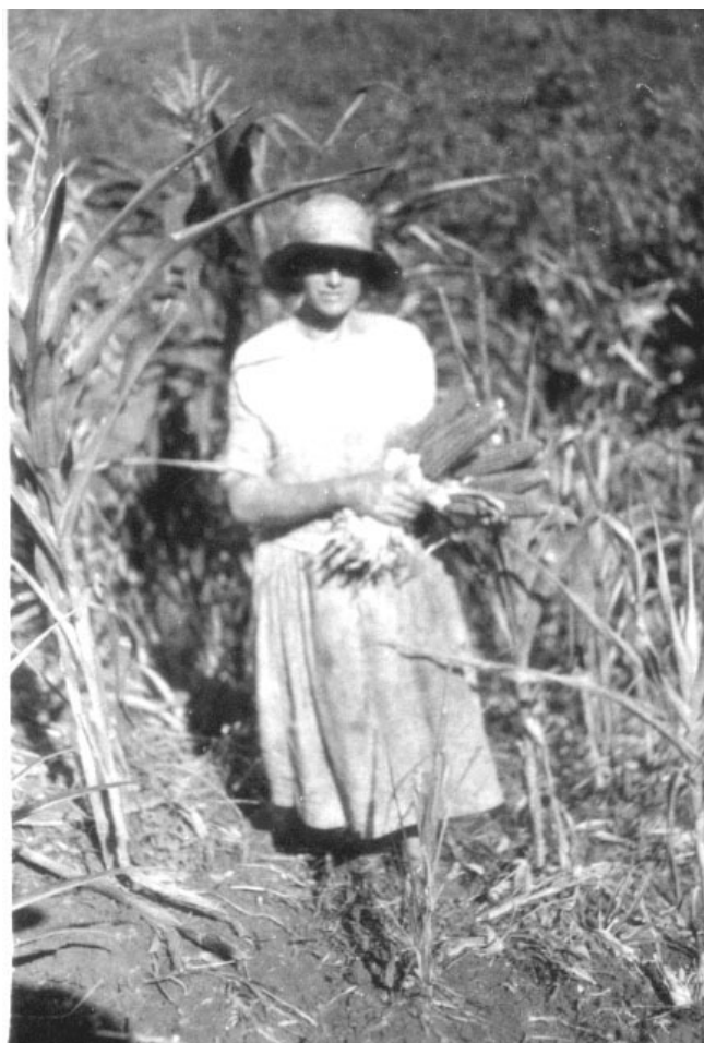
Kukuřice sklízí se i třikrát do roka