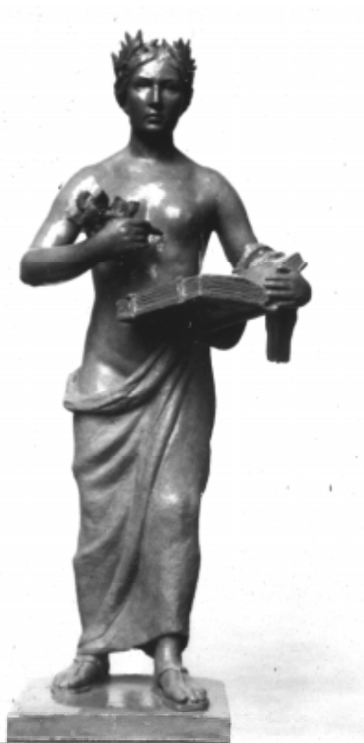
Fotografie nepříliš zdařilých modelů „Historie“ a „Práva“ z dílny sochaře Stino Paukerta. SÚA Praha, AZČ, kart. č. 34.