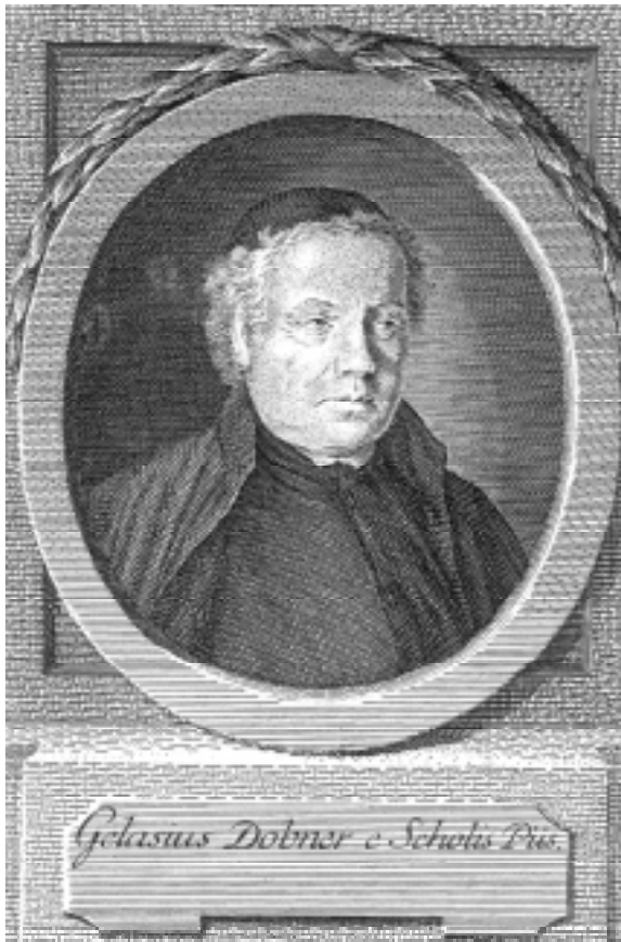
Gelasius Dobner (1719–1790), historik a řádový organizátor. Vydal Kroniku Václava Hájka z Libočan a jako první ji podrobil historické kritice