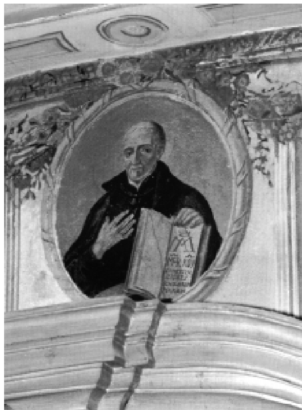
Sv. Josef Kalasanský, malba z pražské piaristické knihovny Na Příkopě z roku 1778 od J. Hagera