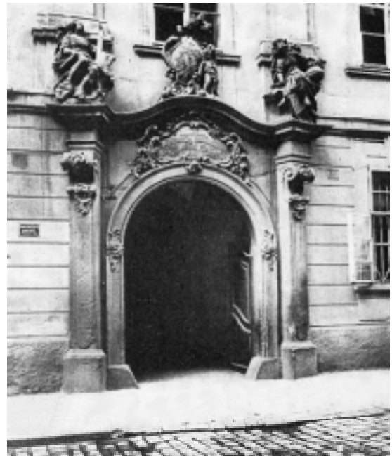
Portál piaristického domu v Panské ulici (dům U černého kocoura)