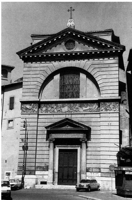
Chrám Sv. Pantaleona (Řím, korzo Viktora Emanuela)