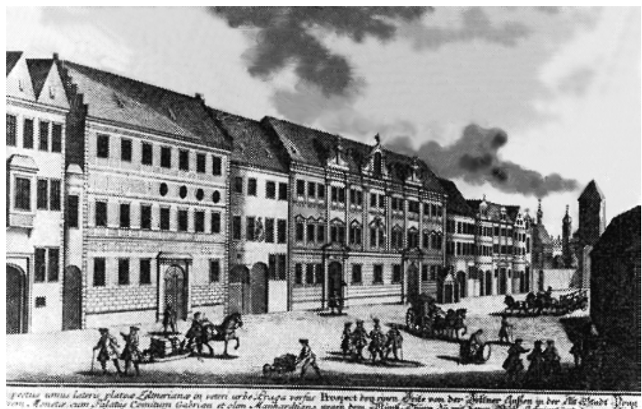
Původní piaristická kolej v Celetné ulici v tzv. Manhartovském paláci