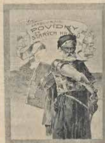
Zeměpisná ukáзка vazy.

Četnými barevnými obrázky vyzdobil J. Weng. Cena váz. výtisku K 3 60.