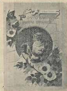
Zeměpisná ukáзка vazy.

HEZKÝMI KNÍŽKAMI, a tu doporučujeme zvláště násl. ve vkusné úpravě četnými obrázky vyzdobené a vícebarev. obrázkem na deskách opatřené: