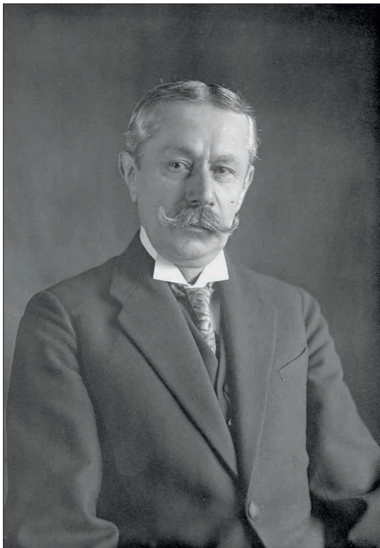
První ředitel Poštovního muzea Václav Dragoun, 1929