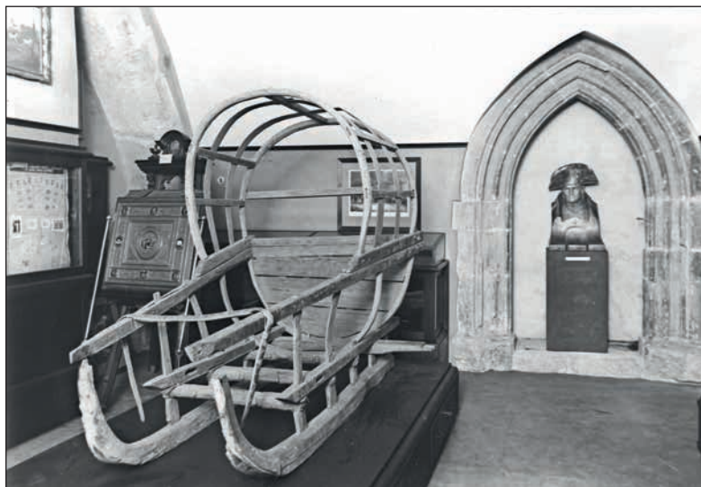
Dřevěné saně, na nichž údajně prchal císař Napoleon I. od Bereziny do Drážďan, v expozici Poštovního muzea v Karolinu, 10.10. 1929