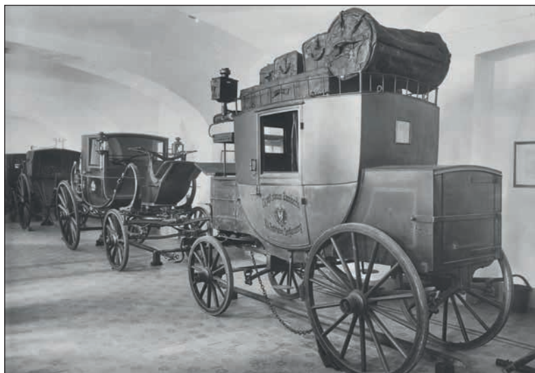
Žamberecký poštovní dostavník v kočárovně Poštovního muzea v Praze na Smíchově, 2.3. 1933