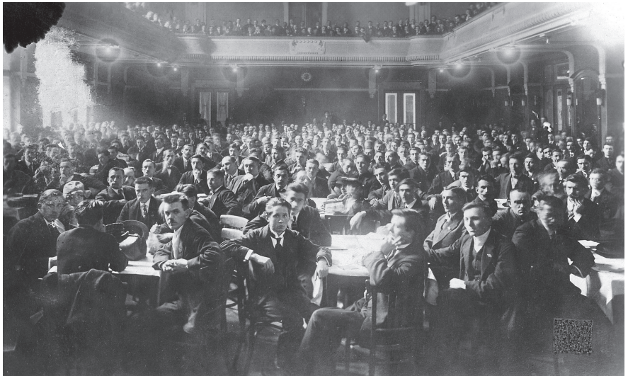
Plénium III. sjezdu KSČ