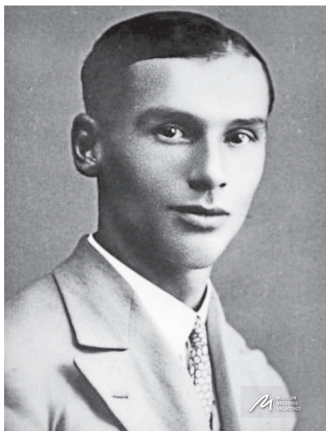
Závěš Kalandra, 1902–1950 (Muzeum regionu Valašsko)