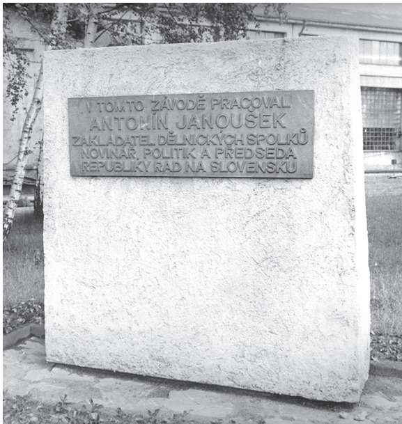
Pamětní deska Antonínovi Janouškovi před železničními dílnami v Nymburce (Vlastivědné muzeum Nymburk)