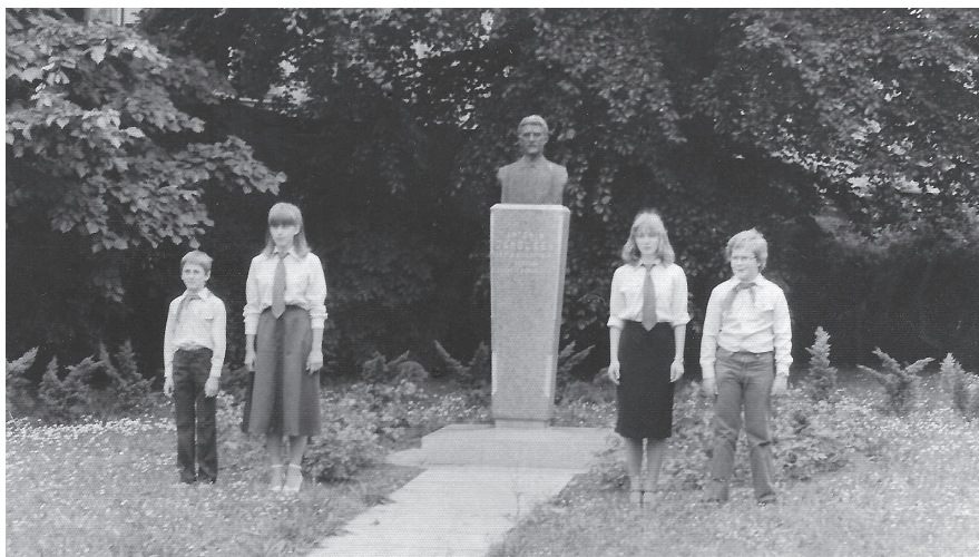
Slavnostní odhalení pomníku Antonínovi Janouškovi před bývalým dětským domovem v Nymburce u železničního nádraží v roce 1972