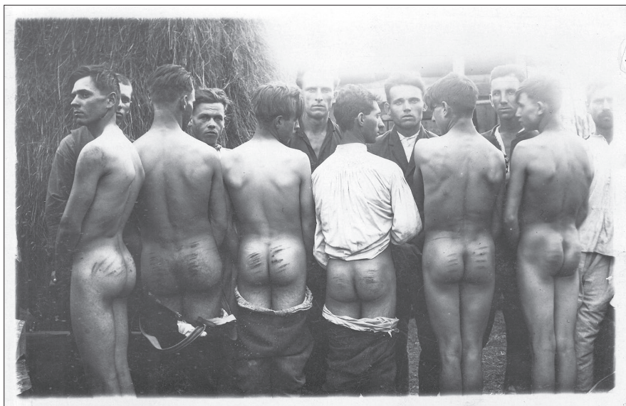
Fotografie boroňavských mladíků seřezaných dne 8. září 1928 pořizená delegací komunistických zástupců Národního shromáždění.