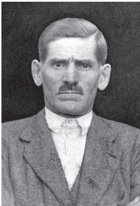
Senátor KSČ Ivan Lokota.