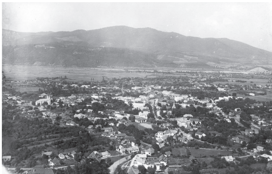
Záběry Chustu z roku 1933 dobře ilustrují jak rozlehlost, tak do značné míry vesnický charakter této sídelní jednotky navzdory jejímu hospodářskému vzestupu koncem dvacátých let.