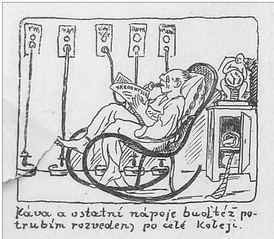
Obr. 2 Humorný návrh na vybavení plánované novostavby koleje s rozvedem některých nápojů v každém pokoji. (Vidle: Humor.-sat. časopis Masarykovy koleje, duben 1924, 4 (3, 4), s. 4)