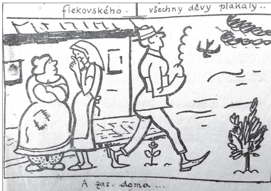
Obr. 5 Kouřící student odjíždějící na prázdniny domů. (Trn. Satirický časopis akademiků, 1923, 2 (5, 6), s. 6.)