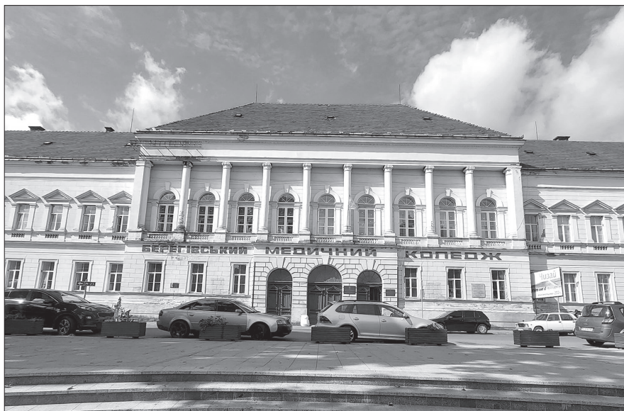
Současný pohled na budovu bývalého Župního úřadu v Berehovu. Dnes sídlo zdravotnické vyšší odborné školy.