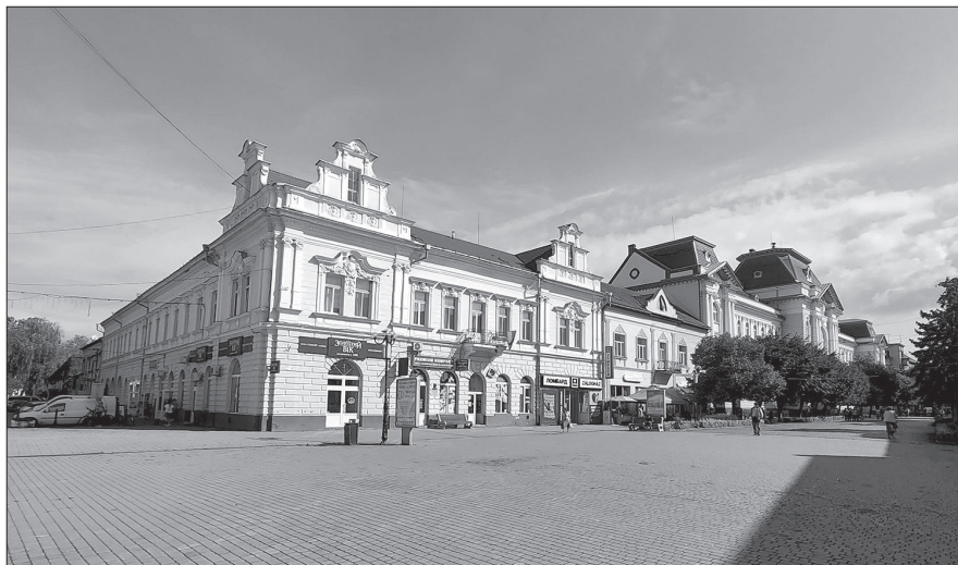
Budova bývalého hotelu Royal na dnešním Kossuthově náměstí v Berehově. (Foto: Luboš Marek, září 2023)