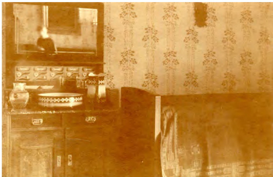
Obr. 9 Tentýž pokoj, pohled od východu. ( NA, ŘM, inv. č. 2769 )