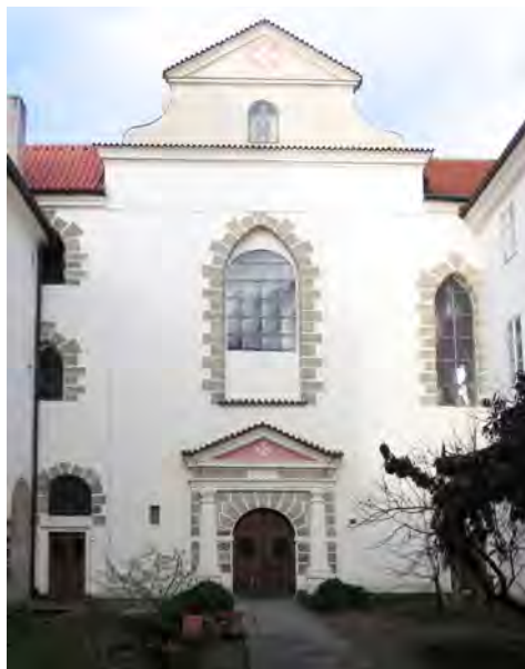
Obr. 5 Současná podoba průčelí konventního kostela Panny Marie pod řetězem.

Dalšího konventního hodnostáře představoval sakristián ustanovovaný převorem. Jeho úkolem bylo udržovat kostelní paramenta v čistotě, včas oznamovat převorovi jejich odcizení či poškození, nabádat kostelníka, aby udržoval