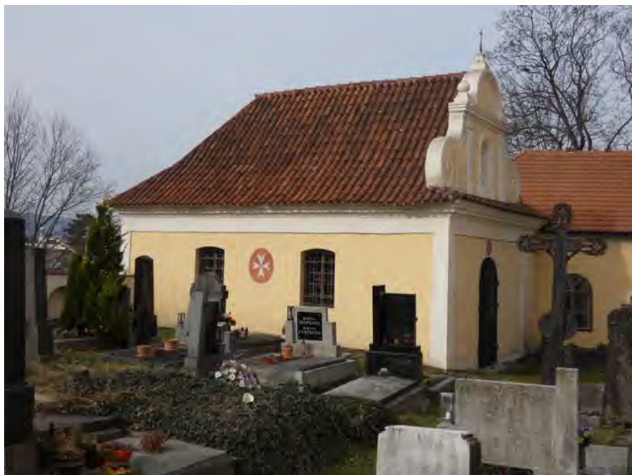
Obr. 11 Maltézská hrobka na hřbitově sv. Václava ve Strakonících.

farním kostele spravována oddělená krypta určená pro zemřelé bratry (S1853/XVI/5). Typickým příkladem je např. maltézská hrobka, respektive kaple sv. Vojtěcha na hřbitově sv. Václava ve Strakonících, která se v nedávné době dočkala dokonce opravy (obr. 11). 59