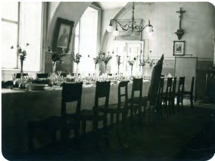
Obr. 6 Letní refektář dne 15. prosince 1928, pohled od severovýchodu.

jedno nebo více jídel, měl být poprvé pouze napomenut, podruhé již potrestán odnětím stravy a pití a potřetí jeho prodloužením. Stejně tak neměl nikdo nárok na jídlo a pití v konventu po dobu, kdy se se svolením neúčastnil společného stravování (NV1819/15). Před jídlem a po něm měly být zbožně vykonány modlitby (S1853/IX/2). Po celou dobu oběda měli dva mladší bratři střídavě číst nejprve z Písma a pak z nějaké duchovní knihy, dokud by představený neudělal znamení dispense (SD1/9). Ostatní měli duchovní četbu vnímat (SD2/12). V jiných pravidlech byl zmíněn jeden předčítající a čtení bylo vztahováno obecně ke stolování (NV1740/15, NV1759/15). Podle Antonína Sychrovského mělo svaté předčítání probíhat po modlitbách před poledním jídlem (S1853/IX/3). Refektář, stůl i nádobí měly být udržovány v čistotě (S1853/IX/8). Příslušné inventáře a jejich uchování měl na starost provizor domu, který si měl vést o všech vydáních přesné účty (S1853/IX/9).