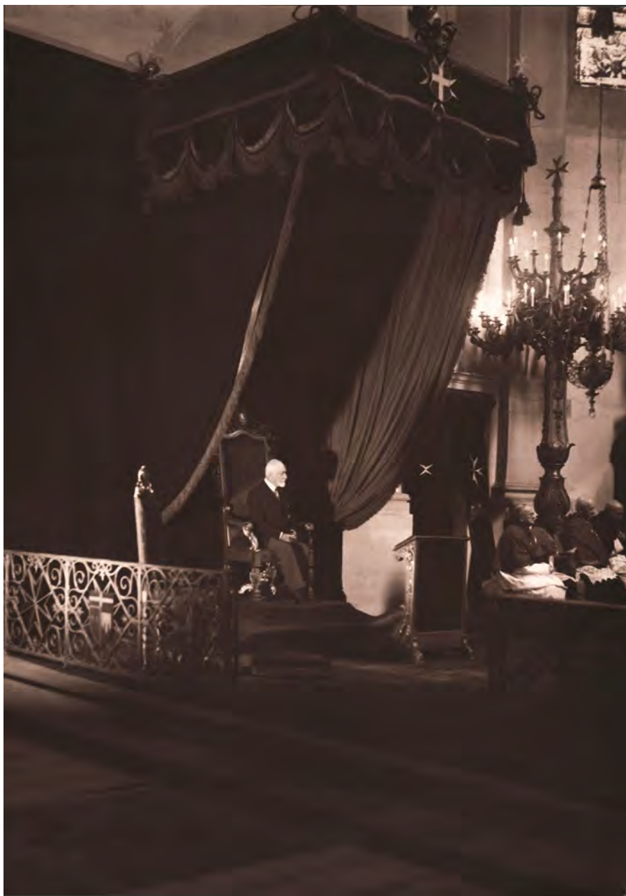
Obr. 13 Evangelijní strana chóru v kostele Panny Marie pod řetězem při návštěvě velmistra Ludovica Chigi Albaniho v srpnu 1931. (NA, RM, inv. č. 2769)