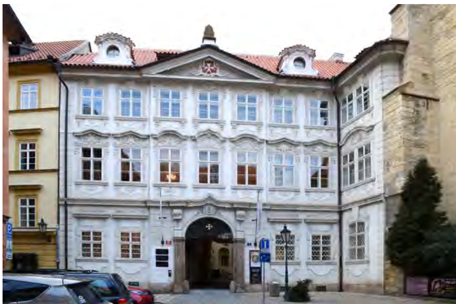
Obr. 4 Současná podoba průčelí budovy konventu.

beneficiím (S1853/XII/5). Přitom měl uvést všechny jejich kvality, zásluhy a ancienitu (NV1740/5, NV1759/5, NV1819/5). Je tedy zřejmé, že převor rozhodoval o přidělování či odebrání duchovní správy a správy sakristie (NV1740/4, NV1759/4, NV1819/4). Kostelní převor byl povinen každý rok předkládat konventní a kostelní účty provinciální kapitule nebo assemblée k přezkoumání. Pokud by převorem nebyl kaplan po právu, respektive konventuální kaplan, měl předkládat účty velkopřevorovi, za což od něho měl být kvitován (NV1740/10). Následně bylo toto pravidlo změněno tak, že to měl předat velkopřevorovi jen v případě absence kapituly (NV1759/10). Při další úpravě těchto předpisů byl velkopřevor úplně vypuštěn (NV1819/10). Převor nebyl oprávněn bez předchozího vědomí velkopřevora a všech konventuálů používat konventní a kostelní kapitál. Výdaje a kvitance podepisoval vedle převora i podpřevor, přičemž v 18. století se k tomu přitiskovala ještě konventní pečeť. Převor sám nesměl nic ze statků a majetku kostela nebo konventu zcizit či pronajmout. Dočasný pronájem mohl učinit se souhlasem podpřevora. K dědičnému pronájmu nebo zcizení se neměl nikdy zavázat bez svolení řádové vrchnosti a zeměpána. Převor měl samozřejmě dbát, aby nedošlo ke ztrátě získaného kapitálu (NV1740/11, NV1759/11, NV1819/11). Dočasný převor nesměl půjčit velkopřevorovi peníze.