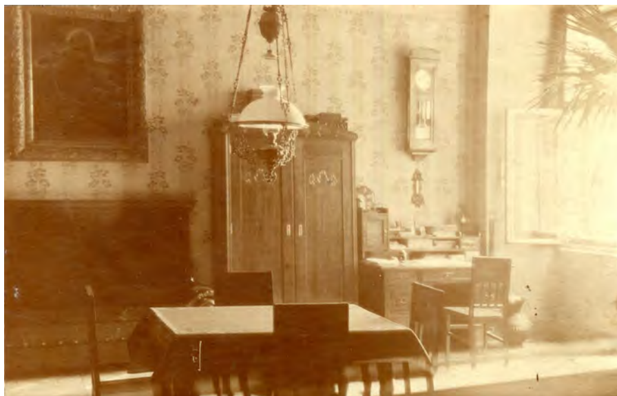
Obr. 8 Pokoj pravděpodobně klerika počátkem 20. století, pohled od západu. ( NA, ŘM, inv. č. 2769 )