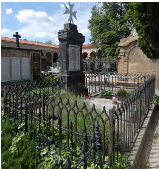
Obr. 10 Hrobka maltézských kněží na Vyšehradském hřbitově používaná v letech 1886–1992. (Foto: Pavel Trnka, 2024)

a taláry (Traktat/21). Zemřelému bratru byl připraven čestný průvod dle zvyklostí místa (S1853/XVI/3). Pohřben měl být v kryptě v souladu se statuty (NV1740/8, NV1759/8). 56 V Praze měli řádoví kaplani svoji vlastní hrobku přímo v konventním kostele Matky Boží pod řetězem. Ta fungovala jako pohřebiště až do roku 1784, kdy bylo císařským dekretem nařízeno uzavření mimo jiné všech hrodek nacházejících se uvnitř obcí. 57 Novým místem posledního odpočinku se pak na dalších sto let stala hrobka na Malostranském hřbitově. 58 Po uzavření hřbitova v roce 1884 začali být řádoví duchovní pohřbíváni do nové hrobky na Vyšehradském hřbitově (obr. 10). Kromě toho měla být na každém hřbitově při řádovém