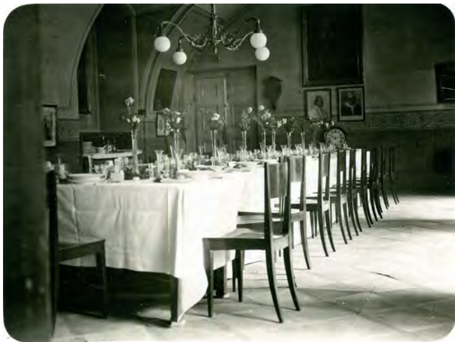
Obr. 7 Letní refektář dne 15. prosince 1928, pohled od jihozápadu. (NA, ŘM, inv. č. 2769)

podávala k obědu polévka, hovězí maso s křenem apod., dvě masitá vařená jídla a pečeně. Někdy k tomu dostávali rovněž salát. K večeři to pak byla polévka, vařené maso a pečeně bez salátu (NV1740/15, NV1759/15). Na základě velkopřevorova pověření z 20. června 1811 došlo na další omezení, když byl odstraněn ve všední den druhý masitý pokrm k obědu i k večeři (NV1819/6). Běžný oběd tak poté sestával z polévky a hovězího masa. Jen o nedělích a svátcích měli bratři nárok na dvě vařená masitá jídla nebo zeleninu a pečení, sem tam to bylo zpestřené salátem. Večeře zůstala v původní podobě jen v neděli a ve svátek. V pondělí, ve středu a v sobotu se servirovala polévka a vařené maso, kdežto v úterý a ve čtvrtek polévka a pečeně (NV1819/15). O svátcích duplex, konkrétně na Velikonoce, Letnice, Štědrý večer, Nový rok, Zelený čtvrtek, sv. Jana Křtitele a jeho Stětí, Nalezení svatého Kříže, byla bratrům povolena k obědu dvě vařená jídla a jedna pečeně navíc (NV1740/15, NV1759/15, NV1819/15). V postní dny, kdy se mělo držet pokání zdrženlivosti, bývala k obědu polévka, vaječný pokrm a kapr nebo jiná ryba (NV1740/15). Následně to bylo rozšířeno ještě o moučné jídlo (NV1759/15) a zeleninu (NV1819/15). K večeři se potom podávala polévka, moučný pokrm a ryba (NV1740/15, NV1759/15). Později však již ryba